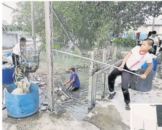
身虽小，力气大，小学生也一起卖力参与捞垃圾运动。

另外，吉胆岛则有吉胆港尾区民众会堂、竟智华小、吉胆艺术协会及吉胆谢氏公会青年团合办，包括师生约70人参与的大扫除活动，该区师生