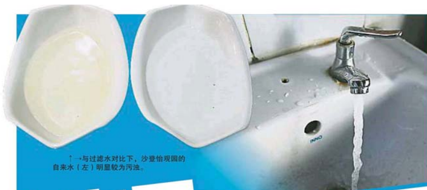
↑与过滤水对比下, 沙登怡观园的自来水(左)明显较为污浊。