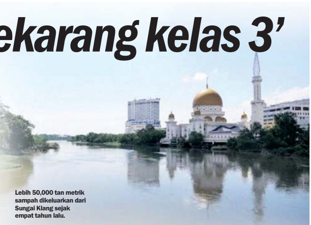
Lebih 50,000 tan metrik sampah dikeluarkan dari Sungai Klang sejak empat tahun lalu.

oleh pihak tidak bertanggungjawab," katanya.