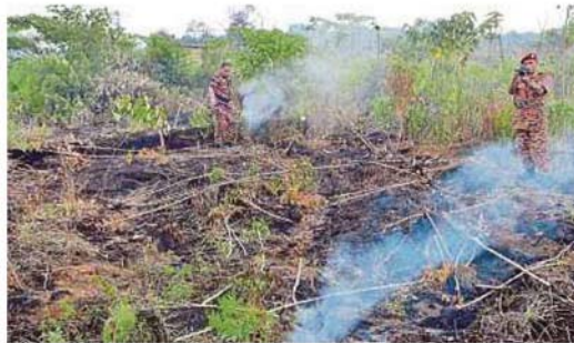
Fire and Rescue Department personnel inspecting the site of open burning in Johan Setia, Klang, recently.

T WENTY agricultural landowners in Johan Setia here risk having their plots confiscated by the Selangor government after they were found to have conducted open burning during the haze period recently.