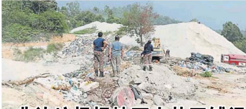
后，已填上泥土。 垃圾场的地下火扑灭