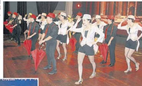
會，呈獻芭蕾舞團舞曲。峇株巴轄晉江會館舞蹈組在晉江930舞蹈交流會

“婦女、家庭及社會發展部副部長楊巧双已宣布，從11月至明年12月31日，托兒所將享有20%電費回扣，希望本地業者踴躍向福利局註冊，以享有回扣。”