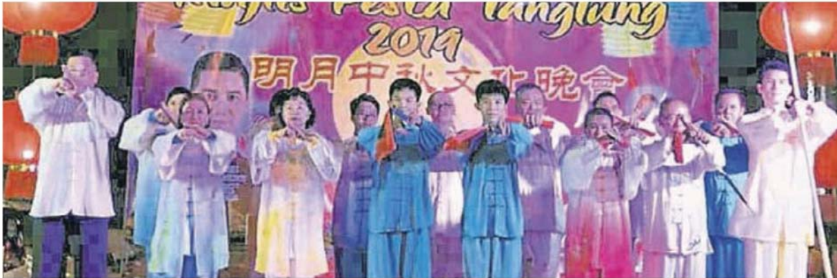
日參加Spectrum表演。 吉隆坡陳式太極拳協會 9月12

(安邦1日讯) 吉隆坡陈式太极拳协会日前受邀出席两项中秋文化晚会, 及在马来西亚日庆典上表演。